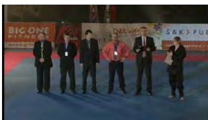
Poděkování nakonec Budoshow 2013