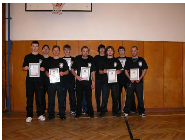
Ukončení kurzu Krav Maga Hustopeče 12/2010 – 03/2011