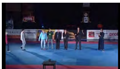
Poděkování nakonec Budoshow 2011