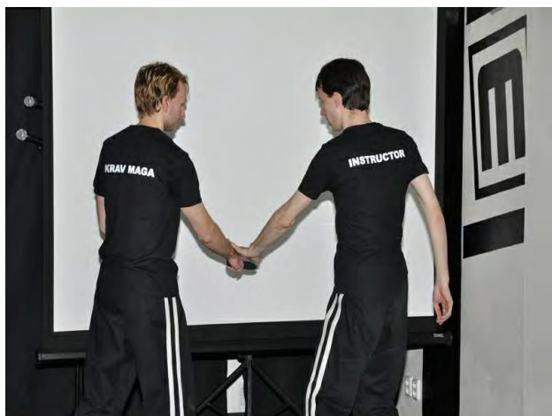
Mládež a prevence proti zločinu Hustopeče 07. 12. 2010