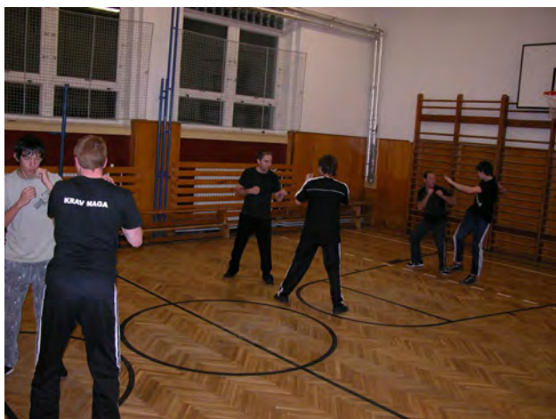
Workshop Krav Maga – Kapap Hustopeče 11. 11. 2010