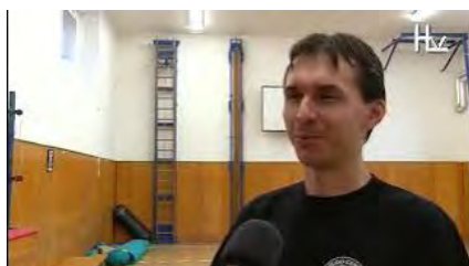
Nábor karate a sebeobranu 2013