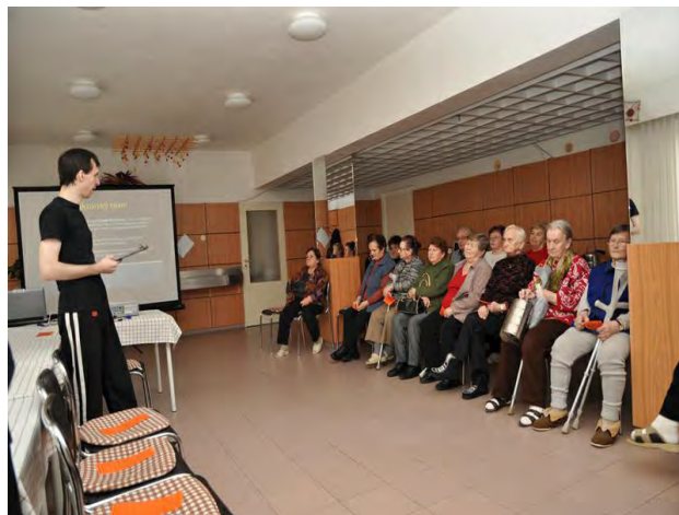
Senioři a prevence proti zločinu Hustopeče 30. 11. 2010