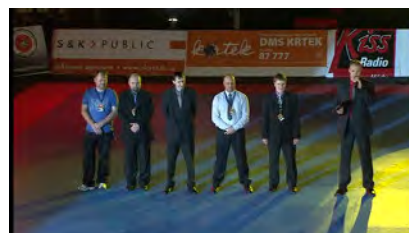
Poděkování nakonec Budoshow 2012