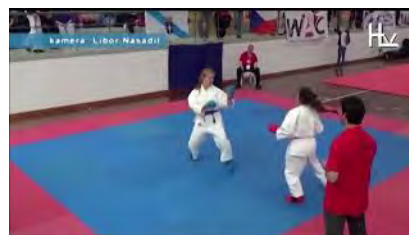
Mistrovství světa v Portugalsku 2014