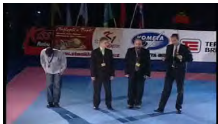
Poděkování nakonec Budoshow 2010