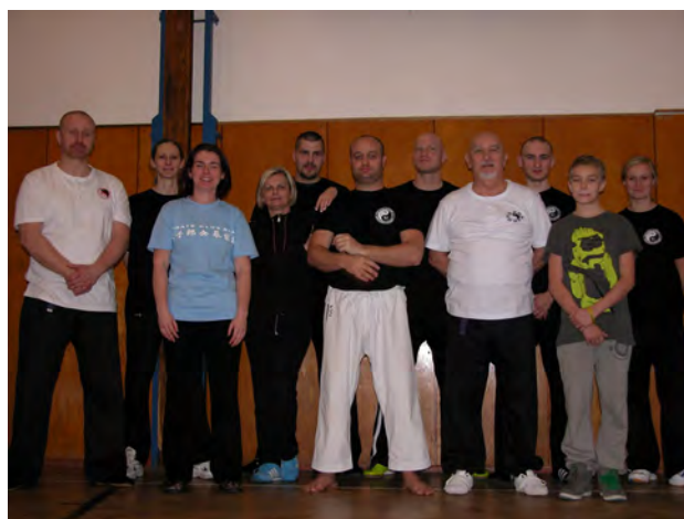
Seminář Yaw Tai Chi Self Defence Hustopeče 12. 01. 2013