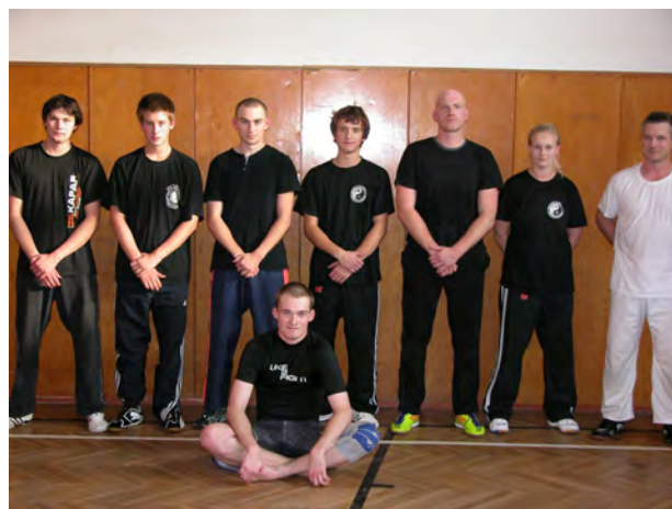
Seminář Brazilského Jiu Jitsu Hustopeče 10. 11. 2012