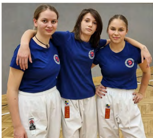
Vánoční cvičení pro rodiče - 2023