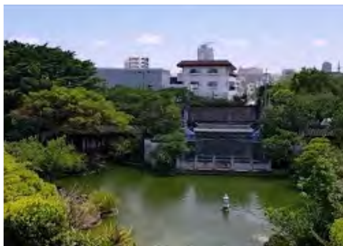
Japonsko - 2019