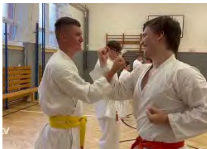
Nábor ABC - Karate 2023/2024