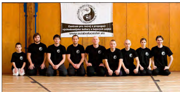
Seminář Sebeobraný a Taekwondo ITF Hustopeče 15. 12. 2012