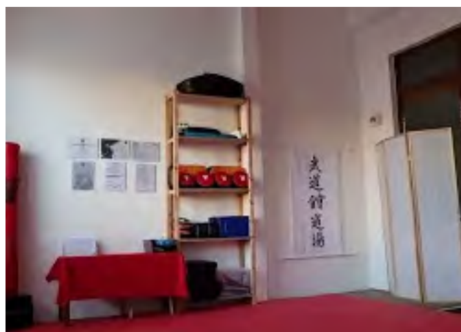
Soukromý prostor - Dojo