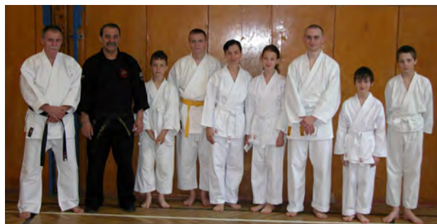
Zkoušky STV Goju-Ryu Hustopeče 11. 05. 2013