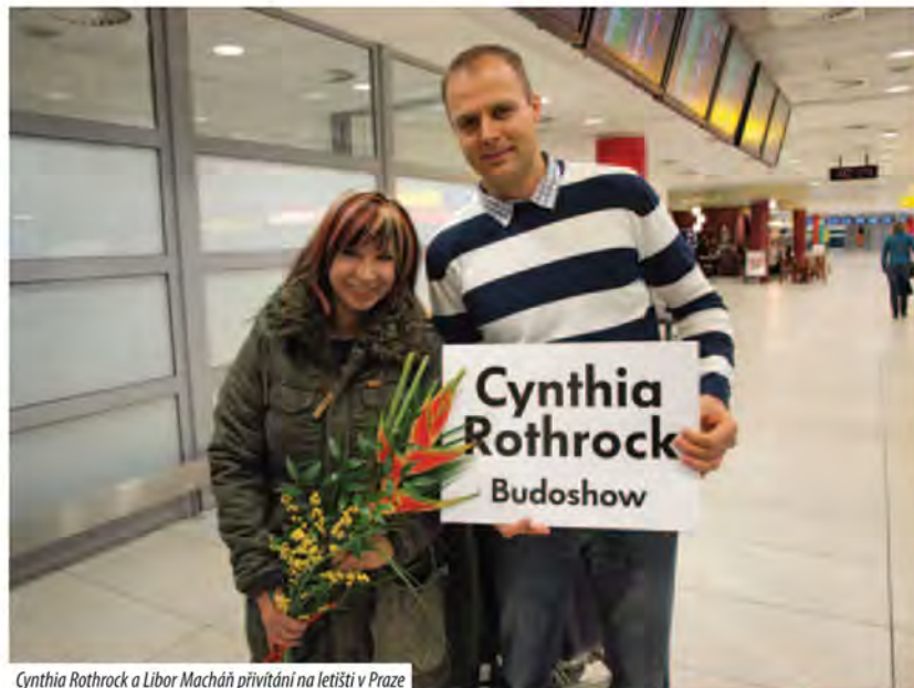
Cynthia Rothrock a Libor Macháň přivítání na letišti v Praze

V 19.00 hodin bylo první večerní setkání s pořadateli Budoshow a všech zainteresovaných osob, kteří se podíleli na pobytu u nás v ČR. Po krátkém brífinku, získala Cynthie přesné informace o itineráři, co pro ni pořadatelé na každý