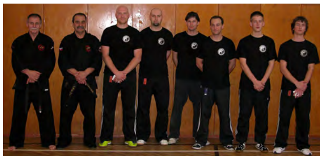
Zkoušky STV Sebeobrana Hustopeče 11. 05. 2013