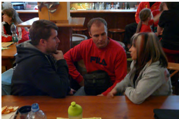
Setkání se Cynthií Rothrock Mnichov, Německo 06. 04. 2013