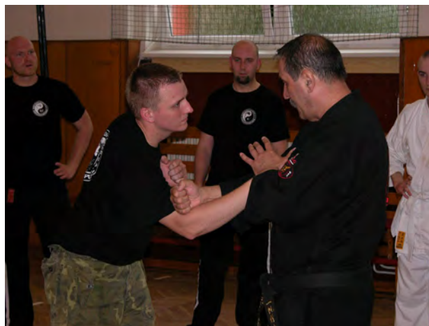
Seminář Kajukenbo Hustopeče 11. 05. 2013