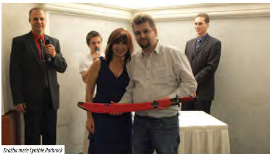
Dražba meče Cynthia Rothrock

zprostředkovat všem posluchačům první dojmy z návštěvy Cynthia v Brně a položit jí několik všeobecných otázek.