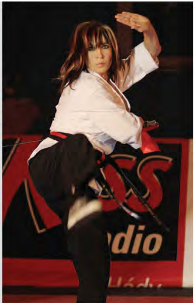
www.budoshow.com